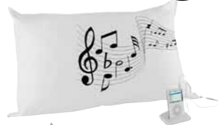
Ein Musikkissen „Sound Asleep“ von Techgalerie.de. Wert: 24,90 Euro