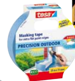
Zehnmale eine Rolle Malerkrepp „Precision Outdoor“ von Tesa. Wert: je 4,49 Euro