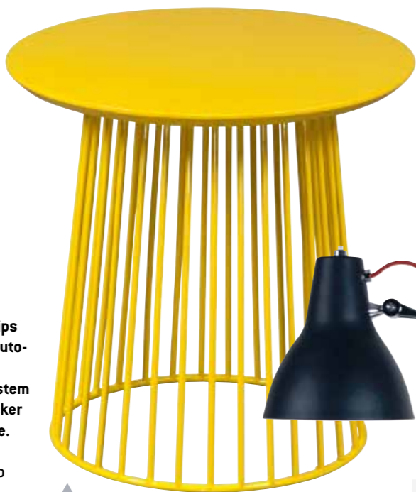
Zweimal einen Couchtisch „Luke“ von Fashion for Home. Wert: je 159 Euro