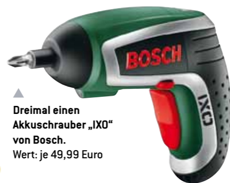
Dreimal einen Akkuschauber „IXO“ von Bosch. Wert: je 49,99 Euro