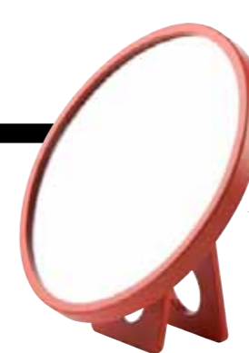
Dreimal einen Kosmetikspiegel „Kali“ von Authentics. Wert: je 22 Euro