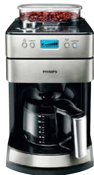
Ein Philips Kaffeeautomat mit Mahlsystem von Necker mann.de. Wert: 129 Euro