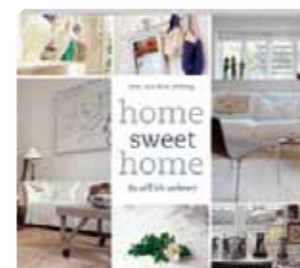
Fünf Bücher „home sweet home“ von Busse Seewald. Wert: je 14,95 Euro