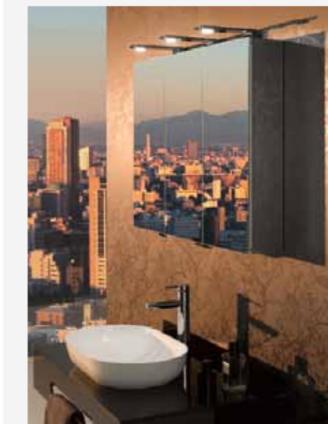
Einen Aluminium-Spiegelschrank „Royal Universe“ von Keuco. Wert: 1004 Euro