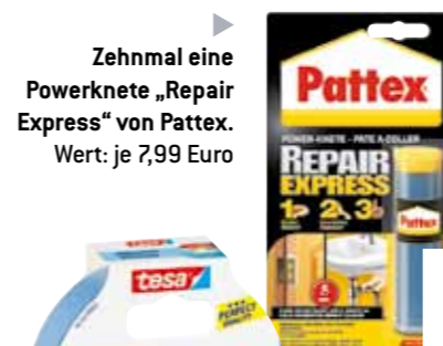
Zehnmale eine Powerknete „Repair Express“ von Pattex. Wert: je 7,99 Euro