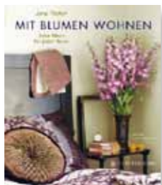
Zwei Bücher „Mit Blumen wohnen“ von Gerstenberg Verlag. Wert: je 24,95 Euro