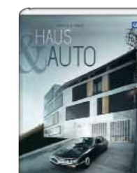
Zwei Bücher „Haus & Auto“ von Callwey Verlag. Wert: je 59,95 Euro