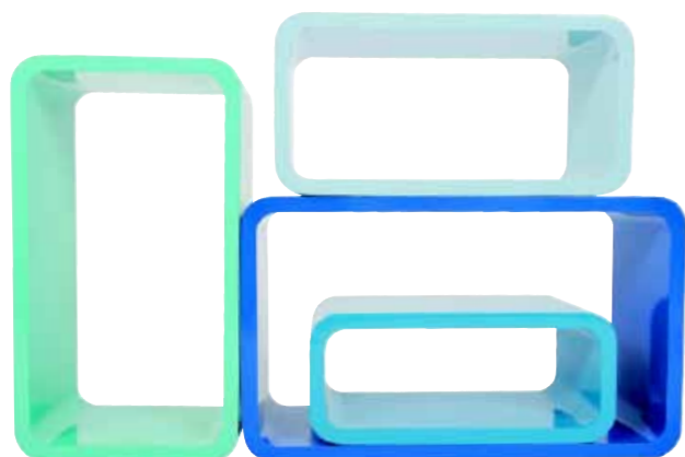
Ein blaues 4er-Regal-Set von Car Möbel. Wert: 139 Euro