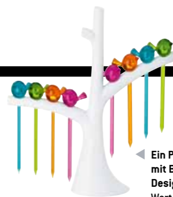
Ein Pikser-Set „Pi-p“ mit Baum von Design3000.de. Wert: 17,75 Euro