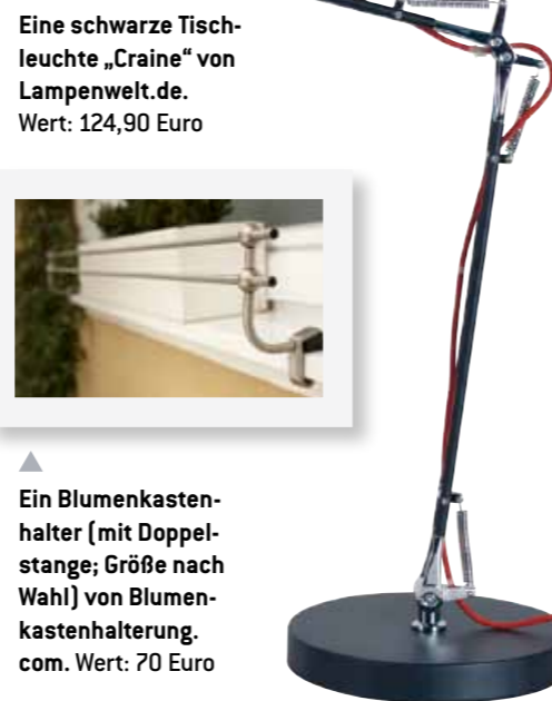
Eine schwarze Tischleuchte „Craine“ von Lampenwelt.de. Wert: 124,90 Euro