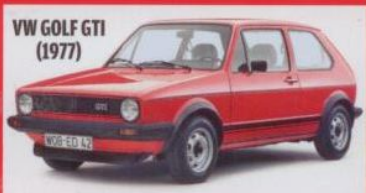
VW GOLF GTI (1977)

45 AUTOS IM TEST So viel Sprit verbrauchen Oldies wirklich