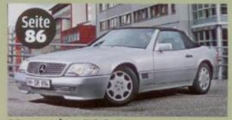
Mercedes 500 SL