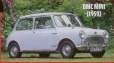
BMC MINI (1959)