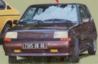
Renault 5 Exclusiv