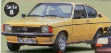
Opel Kadett C Berlinetta