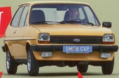
Ford Fiesta Ghia