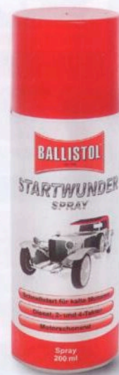
Das Spray BALLISTOL Startwunder macht müde Motoren munter.

Schnelle Abhilfe leistet in solchen Fällen BALLISTOL Startwunder. Es wird einfach auf den Luftfilter bzw. direkt in den Ansaugstutzen des Luftfilters gesprüht. Eine gesondert erhältliche Sprühlanze trägt dabei Rechnung, dass es punktgenau und in jeder Lage aufgebracht werden kann. Der vorhandene Ölfilm wird nicht entfernt