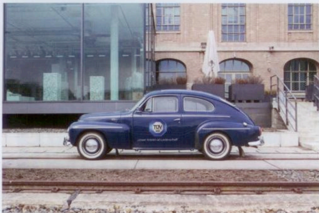
Der Buckel-Volvo ist für den TÜV Süd im Einsatz.

TÜV SÜD Classic bietet ein breites Leistungsangebot, das vom qualifizierten Oldtimer-Gutachten nach § 23 StVZO als Voraussetzung für ein H-Kennzeichen über Änderungs- und Vollgutachten bis hin zu Wert- und Wiederaufbaugutachten für Old- und Youngtimer reicht. Die Experten von TÜV SÜD Classic arbeiten zudem mit einem einzigartigen Archiv; die Datenblätter liefern zu fast jedem Fahrzeugmodell die relevanten Herstellerdaten sowie Fakten für Restauration und Wiederaufbau.