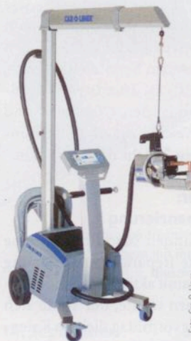
Neues Widerstands-Punktschweißgerät CTR7 von Car-O-Liner