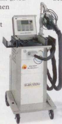
Das Widerstandspunktschweißgerät MI100Control-T

Diagnosearbeitsplätze und Reparaturarbeiten gleichermaßen eignen, so der Hersteller. Auch die weiterentwickelten Viersäulen-Hebebühnen der SM-Serie werden erstmals präsentiert. Die vollflächige Integration des Nachhubs beim Achsvermessungs-Kit ist eine der Detailänderungen.