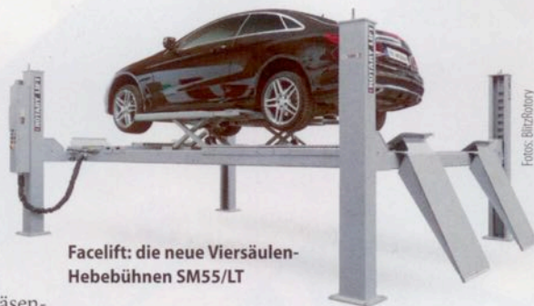
Facelift: die neue Viersäulen-Hebebühnen SM55/LT

Bei der Marke Elektron steht die Batterie im Mittelpunkt. Die neuen Batterieladegeräte HS12 mit 50, 70 oder 120 A werden erstmals vorgestellt. Zudem stehe mit dem Startgerät Easy-Truck nun auch eine 24V Lkw-Version der mobilen Batterie-Startgeräte für Pkw zur Verfügung. Das Elektron Widerstandspunktschweißgerät