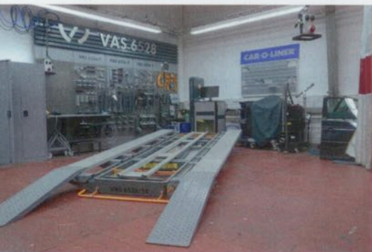
Für die Karosserievermessung setzt das Porsche Zentrum auf ein System von Car-O-Liner.

Um die Messung genau nach den Vorgaben von Porsche realisieren zu können, setzt das Porsche Zentrum Bamberg das Vermessungssystem „Profi Plus VAS 6528“ vom schwedischen Unfall-Reparatur-Spezialisten Car-O-Liner ein. Das Messsystem ist modular aufgebaut und besteht neben einer Rahmenrichtbank mit integrierter Scherenhebebühne aus einem