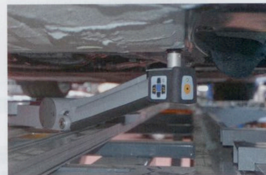
Schritt für Schritt werden alle Messpunkte unter dem Fahrzeug abgefahren.