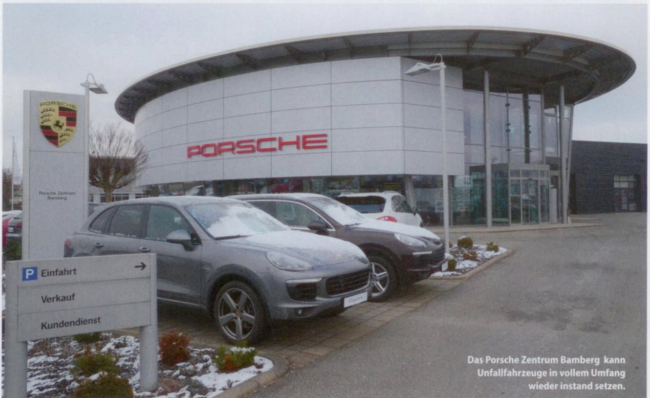
Das Porsche Zentrum Bamberg kann Unfallfahrzeuge in vollem Umfang wieder instand setzen.

Mit einem Unfall-Reparatursystem vom schwedischen Hersteller Car-O-Liner können im Bamberger Porsche Zentrum die Karosserien von Unfallfahrzeugen ohne starre Richtwinkel vermessen werden.