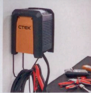
Das neue Werkstattladegerät CTEK PRO 60.