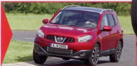
NISSAN QASHQAI DAS IMPORT-SUV NR. 1