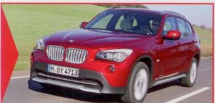
BMW X1 GUT UND WERTSTABIL