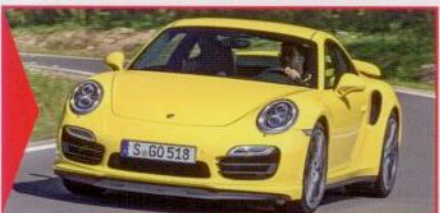
PORSCHE 911 AUCH GEBRAUCHT SPITZE