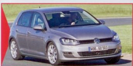
VW GOLF DER BEGEHRTESTE