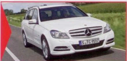
MERCEDES C-KLASSE PREMIUM FÜR ALLE FÄLLE