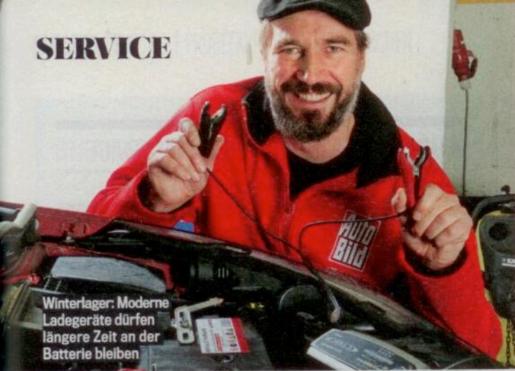
Winterlager: Moderne Ladegeräte dürfen längere Zeit an der Batterie bleiben