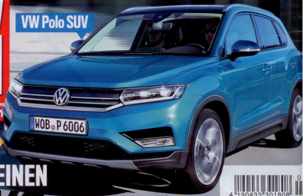
VW Polo SUV