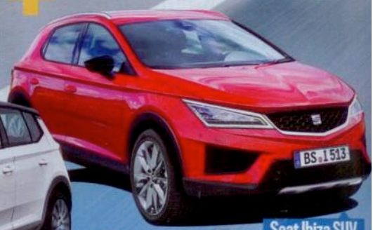
Seat Ibiza SUV