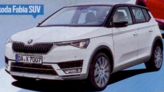
Skoda Fabia SUV

... und das sind + die neuen SUV von Skoda und Seat