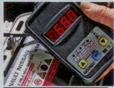
Preiswerte Batterie-Tester gibt es von CTEK oder Novitec zu kaufen