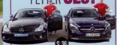
Mercedes CLS 63 AMG

DIE 30 000-EURO- FRAGE: NEUER MERCEDES CLA ODER RICHTIG FETTER CLS?