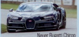
Neuer Bugatti Chiron

Neuer Citroën C3 und die tollen neuen Klein- wagen