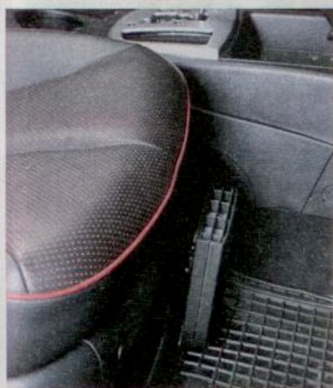
Der Heizlüfter Calix Slimline 800 beheizt den Wagen vom Fußraum her

Die Tage werden kürzer, die Nächte kälter, und das Auto ist morgens schon mal etwas klamm. Damit der Fahrer in ein warmes Auto einsteigen kann und kein Eis kratzen muss, gibt es den Innenraum-Heizlüfter Calix Slimline 800 zum Nachrüsten. Das Gerät wird im Fußraum montiert, von einer Zeitschaltuhr gesteuert und heizt den Innenraum mit Strom aus der Steckdose. Zusätzlich lässt sich noch ein Batterieladegerät und eine Motorvorwärmung einbauen. Dann heizt ein Tauchsieder das Kühlwasser auf. Das schont den Motor beim morgendlichen Anlassen. Die Motorvorwärmung passt zudem die Leistung der steigenden Kühlwassertemperatur an und spart so Strom. Die Innenraumheizung mit Motorvorwärmung und Batterieladegerät gibt es ab 500 Euro. www.seehase.de