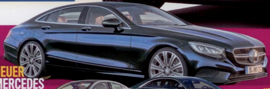
NEUER MERCEDES SEC