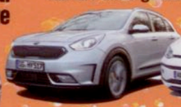
Kia Niro schon gefahren