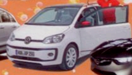
Neuer VW Up