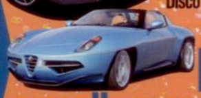
Alfa Romeo Disco Volante Spider