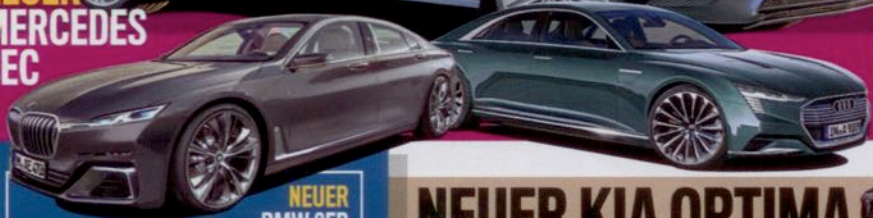
NEUER AUDI C E-TRON

ENDLICH WIEDER TRAUMWAGEN AUS DEUTSCHLAND