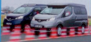
Cristall GEGEN Zoom S. 58