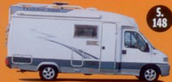
KAUFBERATUNG Hobby 600 – jetzt wird er günstig!