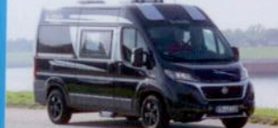
NEUER La Strada Avanti M S. 46