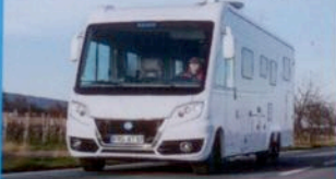
NEUER Knaus Sun i S. 38