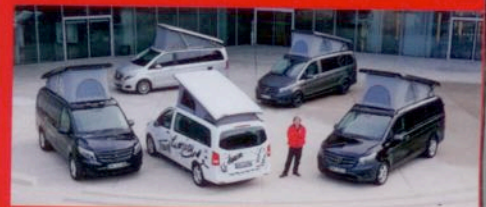
SCHON GEHECKT Neue Camper auf Mercedes Vito S. 94