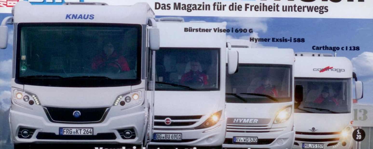
Knaus Van i 650 MEG