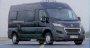
NEUER VanTourer 600 S. 32