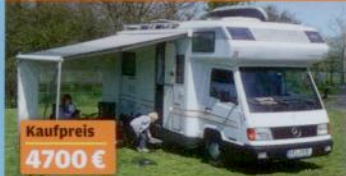
Kaufpreis 4700 €

Leser zeigen ihre SUPERSCHNÄPPCHEN S. 142