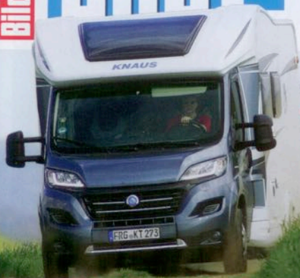
Knaus Sky Wave 650 MF