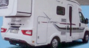
Neuer Adria SLS S. 40