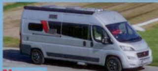
Neuer Bürstner City Car S. 34