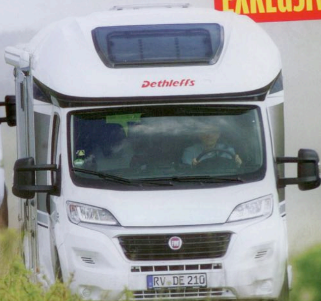
Dethleffs 4Travel 6966