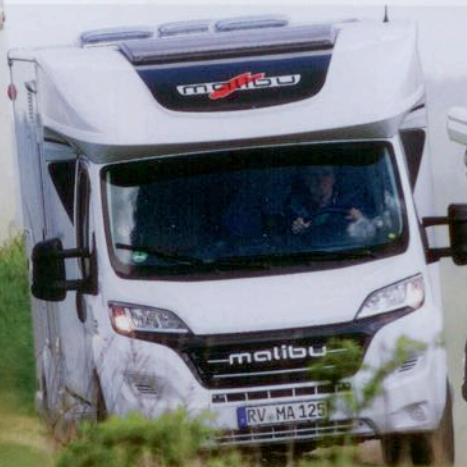
Malibu T 410