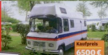
Kaufpreis 6500 €