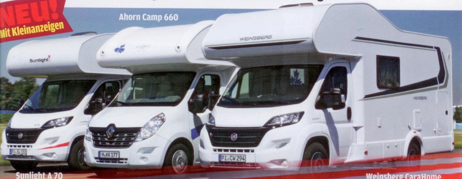
Ahorn Camp 660