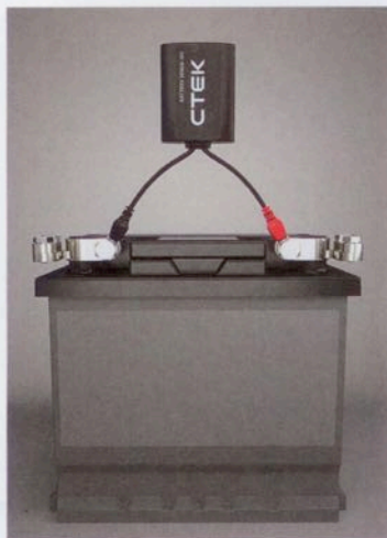
Die Batteriestatusanzeige CTX-Battery-Sense von CTEK übermittelt den aktuellen Ladezustand auf das Smartphone.