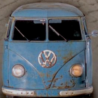
Schneller Barndoor Früher T1 mit Limbach-Motor