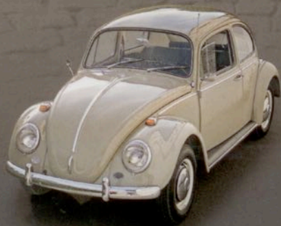
Glück gehabt Lawinenopfer