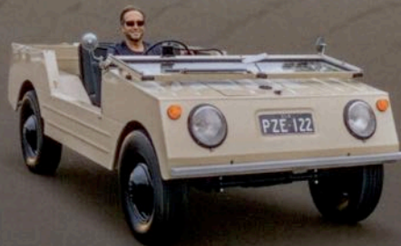
VW Country Buggy Rarität aus Down Under