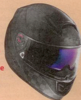
Ein LS2-Helm VECTOR CARBON im Wert von 349,90 Euro