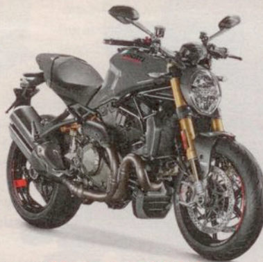
Ducati Monster 1200 S