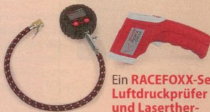
Ein RACEFOXX-Set Luftdruckprüfer und Laserthermometer im Wert von 49,80 Euro