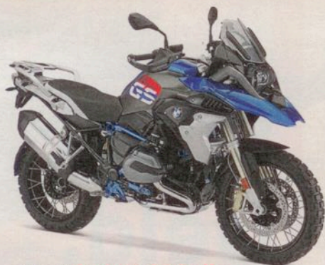
BMW R 1200 GS Rallye