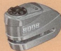
Ein ABUS Alarm Brems- scheibenschloss, GRANIT Detecto 8008 im Wert von 179,95 Euro