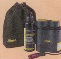
5 x Airman Reifenpannen- set Motorrad im Wert von je 30,00 Euro