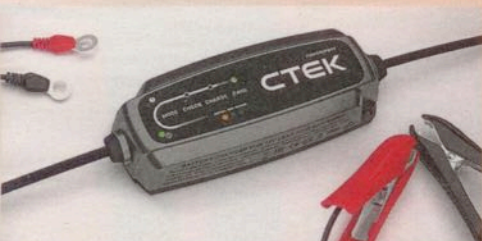
3 x CTEK CT 5 Powersport im Wert von je 89,00 Euro