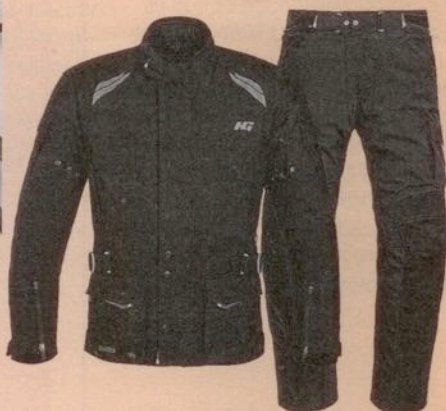
Eine Hein Gericke- Maxwell 7 sheltex Per- formance Jacke + Hose im Wert von 549,98 Euro