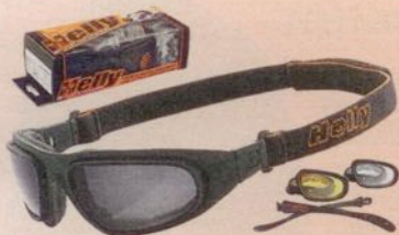
8 x Helly No.1 Bikereyes „eagle“ im Wert von je 49,95 Euro

also eine hohe Dynamik. Nach den Erfolgen der Ducati Scrambler-, BMW R nineT- und Triumph-Klassik-Modelle hat die Kategorie der „Modern Classics“ am meisten davon profitiert. Und obwohl die Supersportler erneut weniger geworden sind, haben sie an technischer Raffinesse noch einmal deutlich zugelegt. MOTORRAD wünscht viel Spaß beim Entdecken der Neuheiten und viel Glück bei der Wahl.