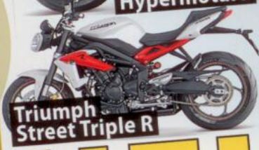
Triumph Street Triple R