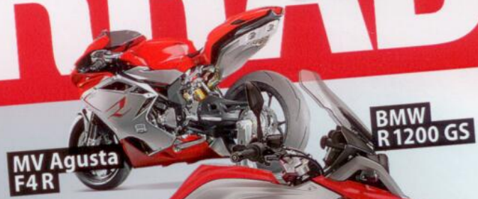
BMW R 1200 GS