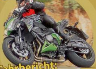
Fahrbericht: Kawasaki Z 800