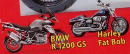
BMW R-1200 GS

ZU GEWINNEN: BMW oder HARLEY oder YAMAHA 15 Preise im Gesamtwert von 40 000 Euro