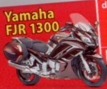
Yamaha FJR 1300

Motorrad des Jahres 2013 MOTORRAD LESERWAHL