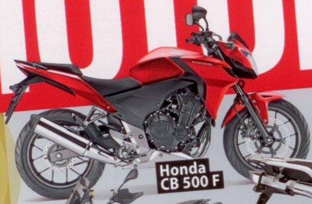
Honda CB 500 F