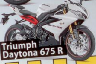
Triumph Daytona 675 R