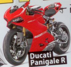
Ducati Panigale R