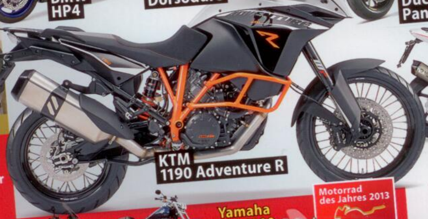
KTM 1190 Adventure R