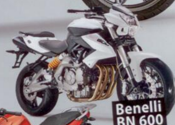
Benelli BN 600