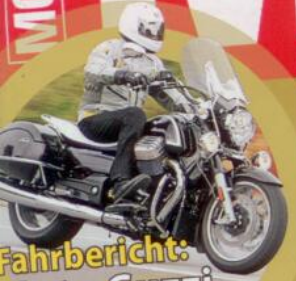
Fahrbericht: Moto Guzzi California 1400