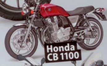
Honda CB 1100