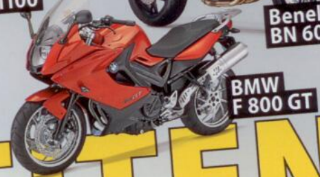
BMW F 800 GT