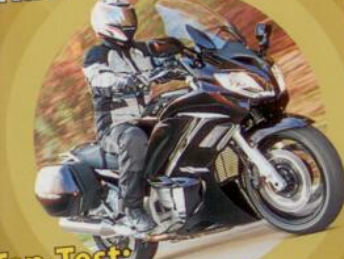
Top-Test: Yamaha FJR 1300