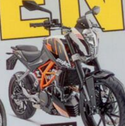
KTM 390 Duke