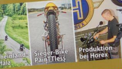
heinland-fälz Sieger-Bike Paintless Produktion bei Hörex