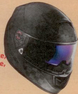
Ein LS2-Helm VECTOR CARBON im Wert von 349,90 Euro