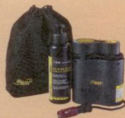
5 x Airman Reifenpannen- set Motorrad im Wert von je 30,00 Euro