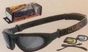
8 x Helly No.1 Bikereyes „eagle“ im Wert von je 49,95 Euro