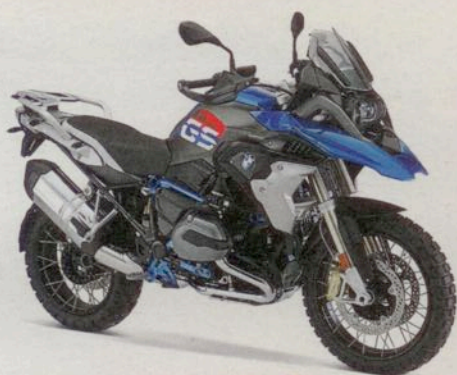
BMW R 1200 GS Rallye