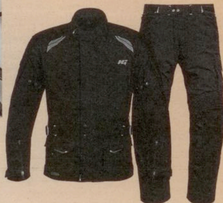
Eine Hein Gericke- Maxwell 7 sheltex Performance, Jacke + Hose, im Wert von 549,98 Euro