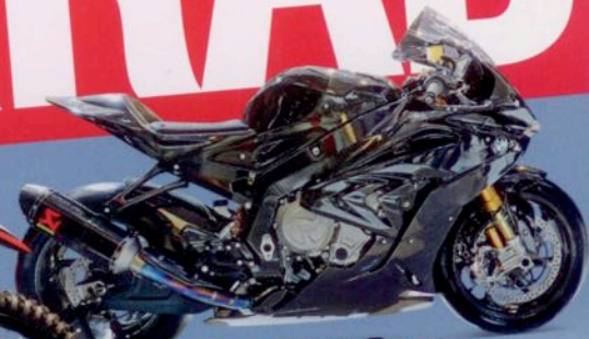
BMW HP4 Race