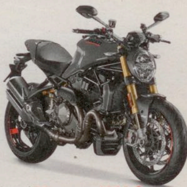
Ducati Monster 1200 S