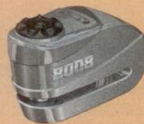
Ein ABUS Alarm Brems- scheibenschloss GRANIT Detecto 8008 im Wert von 179,95 Euro