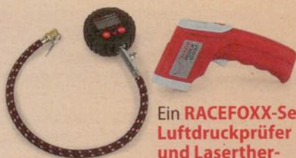
Ein RACEFOXX-Set Luftdruckprüfer und Laserther- mometer im Wert von 49,80 Euro