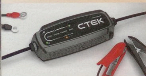
3 x CTEK CT 5 Powersport im Wert von je 89,00 Euro