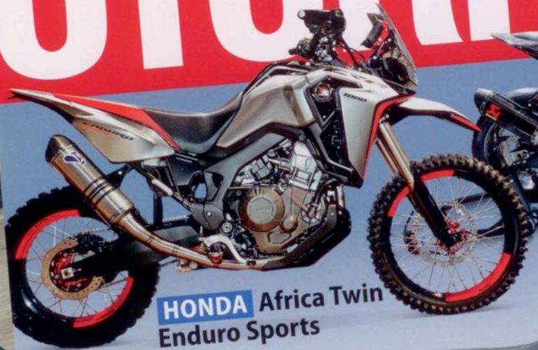
HONDA Africa Twin Enduro Sports