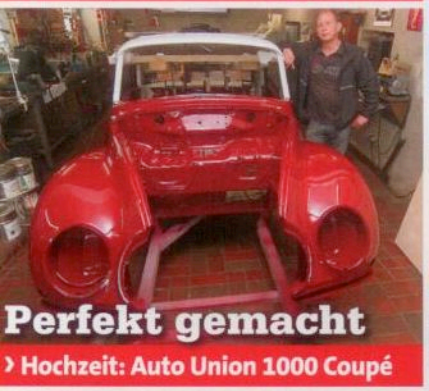
Perfekt gemacht Hochzeit: Auto Union 1000 Coupé