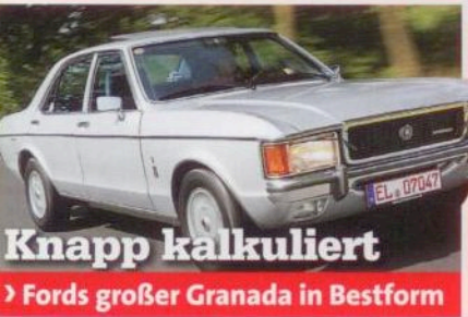
Knapp kalkuliert Fords großer Granada in Bestform