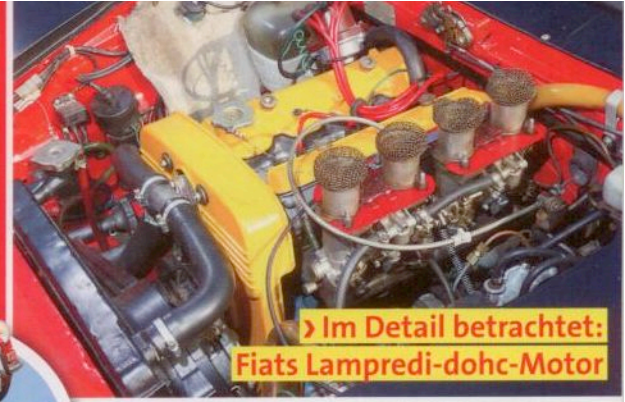
Im Detail betrachtet: Fiats Lampredi-dohc-Motor

100 Seiten! Service, Infos, Technik-Tipps für das schönste Hobby der Welt!