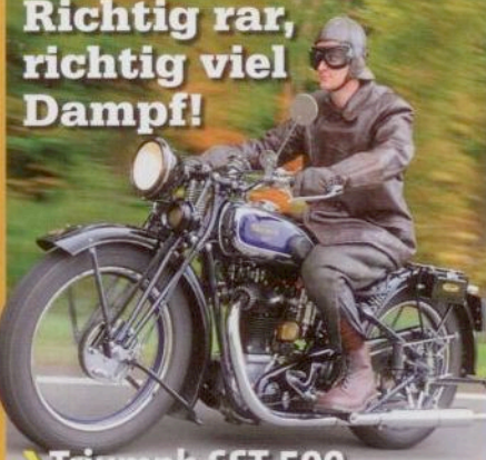
Triumph SST 500