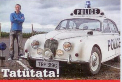
Tatütata! In vollem Polizei-Ornat: Jaguar Mk2