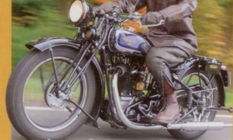
> Triumph SST 500