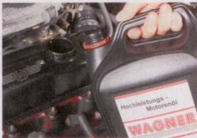
Der Ölwechsel vor der Winterpause entfernt aggressive Verbrennungsrückstände und Schmutz aus dem Motor

12 Motorschutz Für längere Stillstandszeiten gibt es spezielle Motor-Innenkonservierer wie zum Beispiel das Spray von Liqui Moly . Aber auch die üblichen Universal-Kriechöle sind verwendbar. Das Konservierungsmittel lässt sich durch die Zündkerzenbohrungen direkt in die Zylinder spritzen. Alternativ nimmt man den Luftfilter ab und sprüht es in den Vergaser, während der Motor ohne Zündung per Anlasser dreht, Gaspedal auf Vollgas.