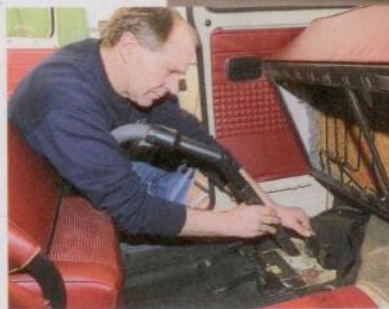
Schmutz bindet Feuchtigkeit und begünstigt Rost und Schimmel. Deshalb steht Großreinemachen als erstes auf unserem Einwinterungsplan

Heutige Kraftstoffe zersetzen sich relativ schnell, so dass schon nach ein paar Monaten die Zündfähigkeit für einen reibungslosen Start ins Frühjahr nicht mehr gegeben sein kann. Außerdem besteht erhöhte Korrosionsgefahr für Tanks, Leitungen, Vergaser und Ein-