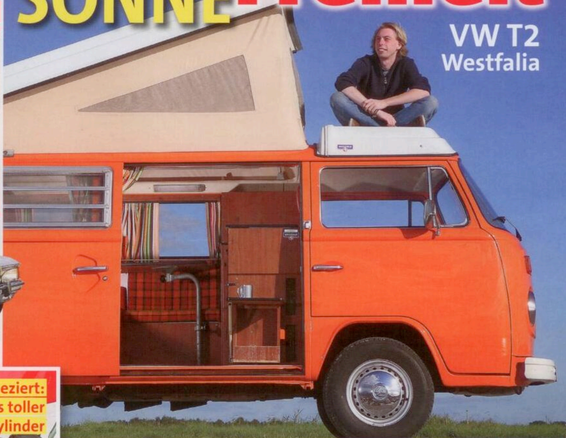
VW T2 Westfalia