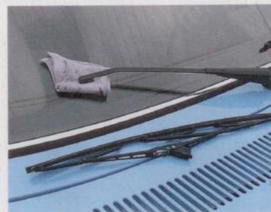
Langer Stillstand deformiert die Gummilippe des Scheibenwischers. Wer das Wischerblatt kurzerhand demontiert, muss aber auch das Glas vor Kratzern schützen

spritzanlagen. Bewegliche Teile können verkleben, Düsen und Filter verstopfen. Äußerst empfehlenswert ist deshalb ein Benzinstabilisator wie zum Beispiel Bactofin von Wagner Spezienschmierstoffe . Nach Zugabe des Mittels sollte der Motor noch eine Zeitlang laufen, damit das Mittel sich in der gesamten Kraftstoffanlage verteilt. Tanken Sie vor dem endgültigen Abstellen voll.