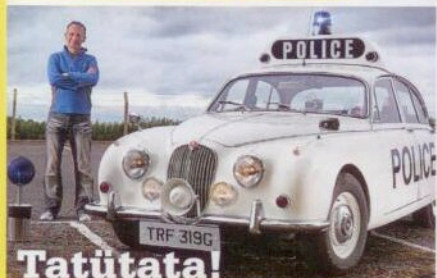
Tatütata! > In vollem Polizei-Ornat: Jaguar Mk2