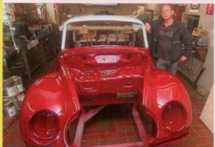
Perfekt gemacht > Hochzeit: Auto Union 1000 Coupé