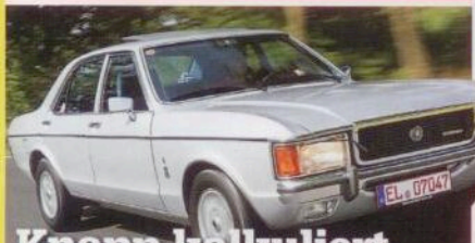
Knapp kalkuliert > Fords großer Granada in Bestform