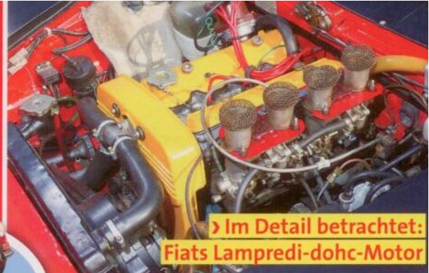
Im Detail betrachtet: Fiats Lampredi-dohc-Motor

100 Seiten! Service, Infos, Technik-Tipps für das schönste Hobby der Welt!