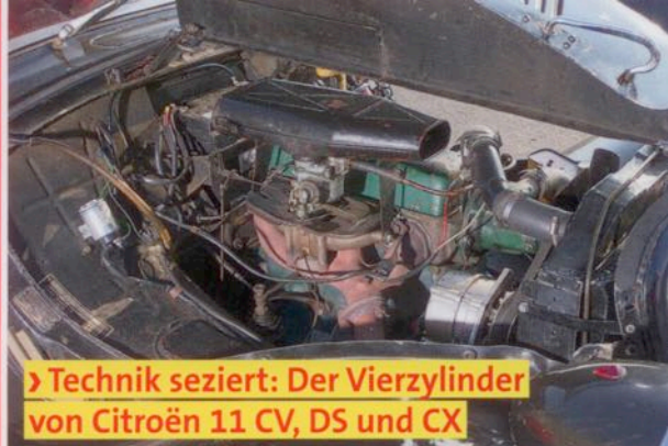
› Technik seziert: Der Vierzylinder von Citroën 11 CV, DS und CX