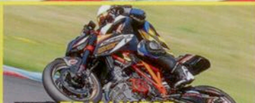
TEST TEAM WEST