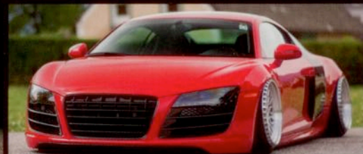
Audi R8 > Breitbau brutal!