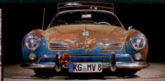
Karmann Ghia > US-Import mit Patina