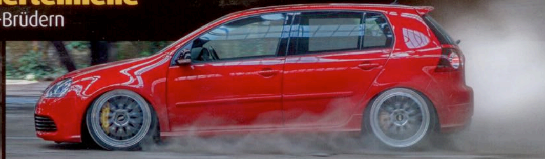
Hubraum ist alles! Golf 5 R36

EXKLUSIV > ERSTE BILDER VOM WOLFSBURGER AZUBI-GTI 2016