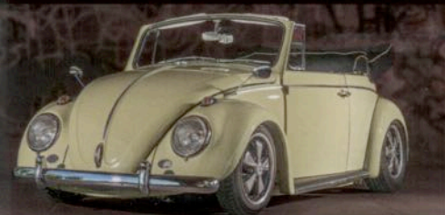
Käfer Cabrio > Mit 140 PS der Sonne entgegen