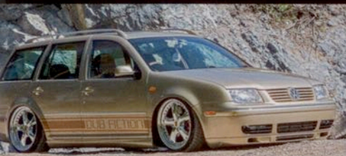
Bora Variant 1 > Second Hand-Tuning in Perfektion!