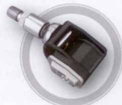
Clamp-in variabler Winkel