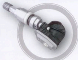
Clamp-in starrer Winkel