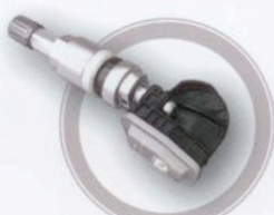
Clamp-in starrer Winkel