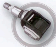
Clamp-in variabler Winkel

Schrader International GmbH Gewerbepark 15 85250 Altomünster, DE