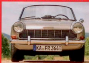
Opel Kadett Spider