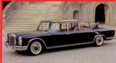
Mercedes 600 Landulet