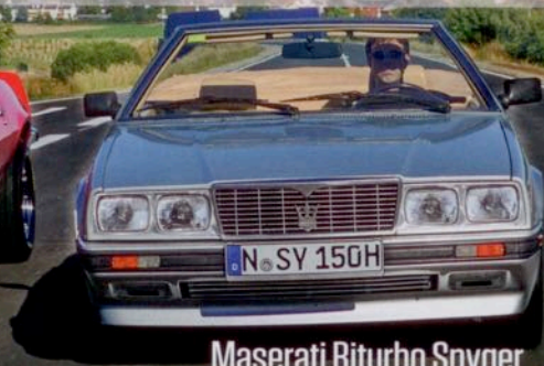
Maserati Biturbo Spyder