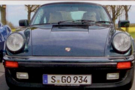
Porsche 911 Turbo