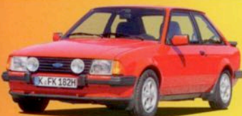
Ford Escort XR3