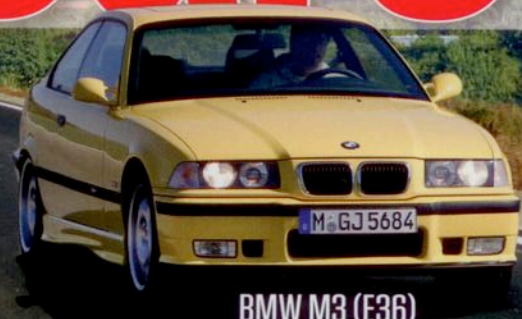
BMW M3 (E36)