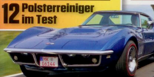
Vergleichstest Chevrolet Corvette C3

Vergleichstest: Familienautos mit Power und Platz Ford Granada - Audi 100 5E - Alfa Romeo Alfetta 2.0 - Rover 2600