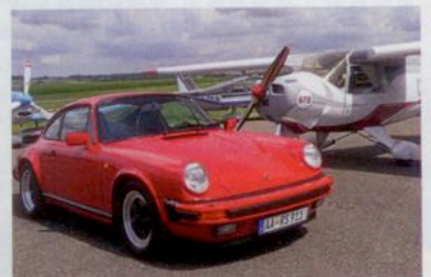
6. Porsche Flug- und Fahrzeugtreffen auf dem Flugplatz Heubach am 6. August 2016

► Stolz stellte Maico sein MaicoMobil, das „Auto auf zwei Rädern“, 1951 auf dem Genfer Autosalon vor. Wenn heute mehrere MaicoMobile in Oberbayern auf Entdeckungsfahrt gehen, ist das Aufsehen groß. Wie einst im Mai flitzten sie pannenfrei über zusammen 1000 Kilometer durch die Sommersonne. Statt im Campingzelt mit Spirituskocher residierte man allerdings vornehm im Hotel.