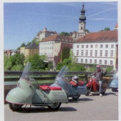
Idyllisch: Vier klassische Maico-Roller auf der Salzachbrücke in Burghausen