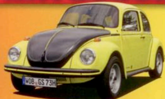
VW 1303 S GSR