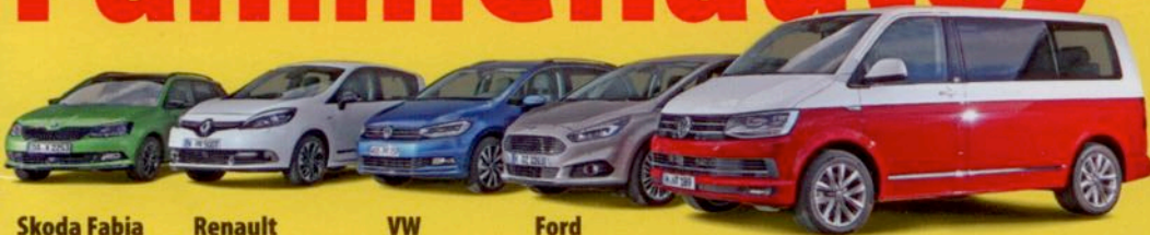
Skoda Fabia Combi