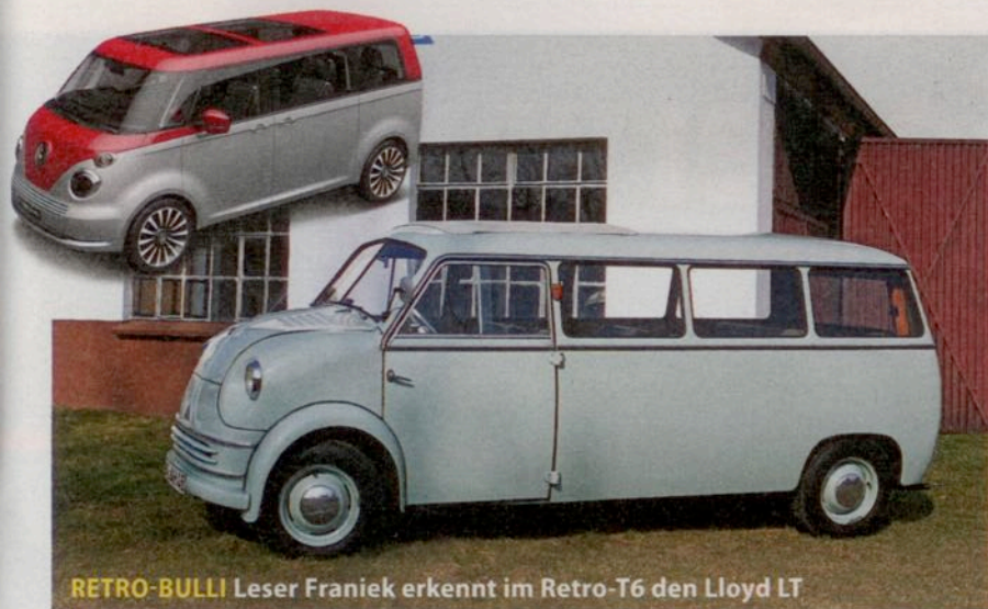
RETRO-BULLI Leser Franiek erkennt im Retro-T6 den Lloyd LT

Nachrichten: Retro-Bulli von David Obendorfer, Heft 6, Seite 4