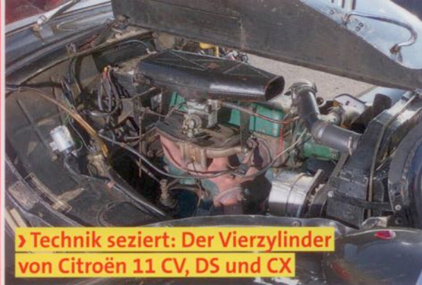
› Technik seziert: Der Vierzylinder von Citroën 11 CV, DS und CX