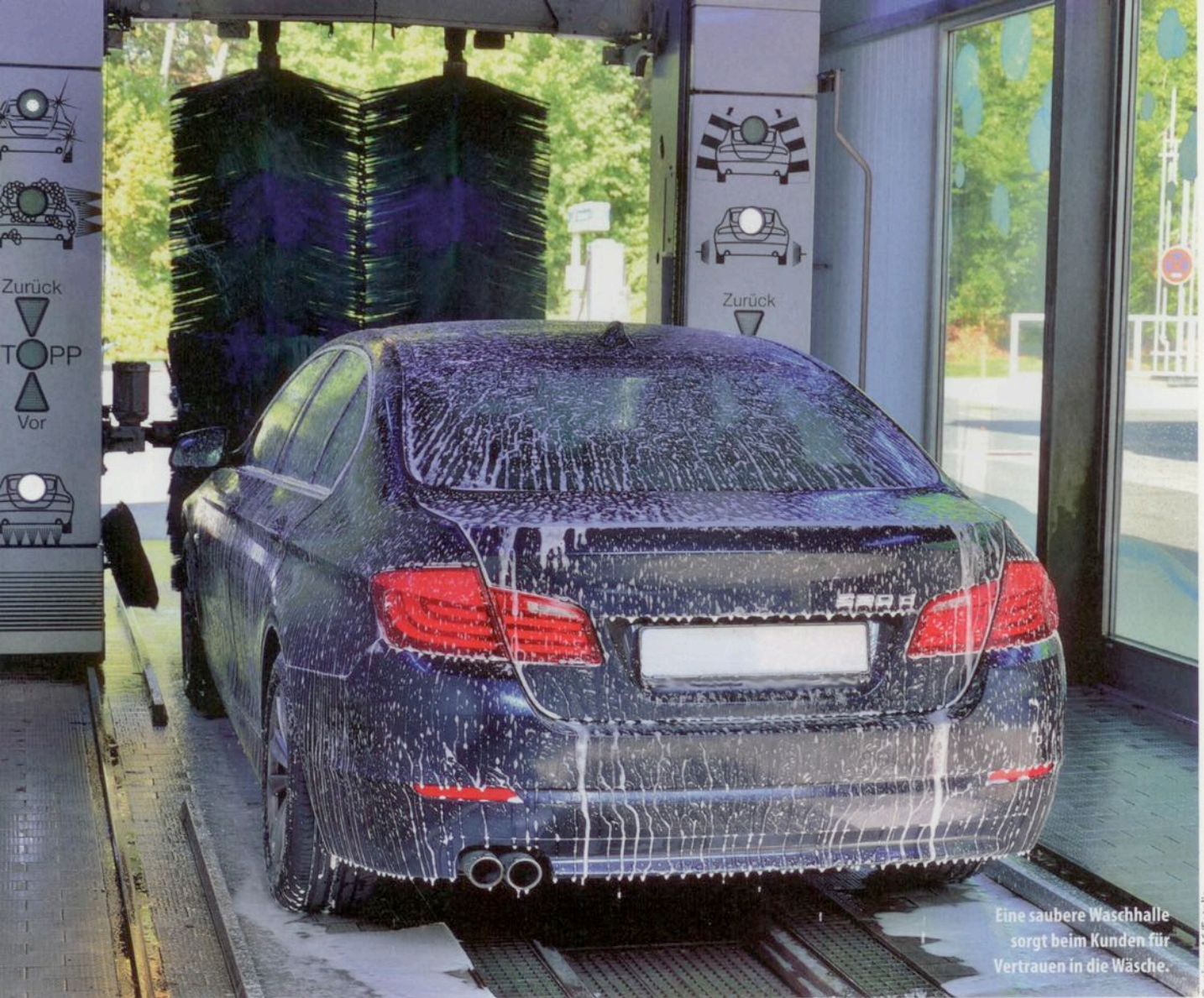
Eine saubere Waschhalle sorgt beim Kunden für Vertrauen in die Wäsche.