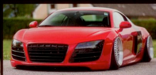
Audi R8 > Breitbau brutal!

Die Kings der Viertelmeile Zu Besuch bei den Schley-Brüdern