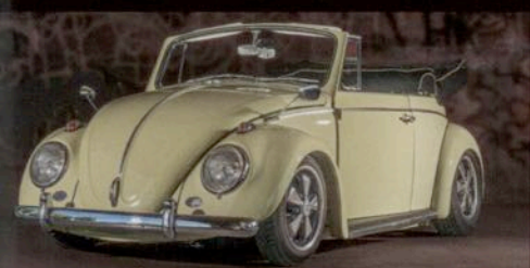
Käfer Cabrio > Mit 140 PS der Sonne entgegen