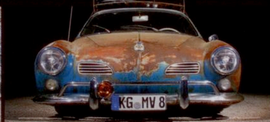
Karmann Ghia > US-Import mit Patina