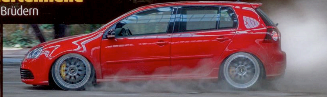
Hubraum ist alles! Golf 5 R36

EXKLUSIV > ERSTE BILDER VOM WOLFSBURGER AZUBI-GTI 2016