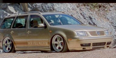
Bora Variant 1 > Second Hand-Tuning in Perfektion!