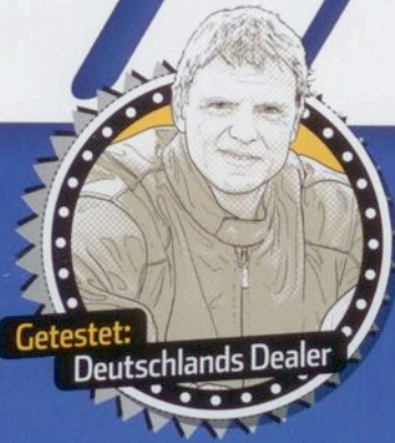
Getestet: Deutschlands Dealer