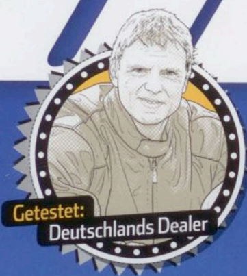
Getestet: Deutschlands Dealer