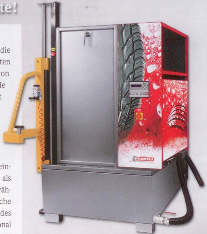
Die Räder benötigen regelmäßig eine professionelle Reinigung von anfallendem Schmutz.

Genau wie das Fahrzeug selbst benötigen die Räder von Nutzfahrzeugen Pflege und sollten in regelmäßigen Abständen professionell von Bremsstaub und Schmutz gereinigt werden. Die Radwaschmaschine Haweka 500HP nimmt einzelne Räder mit einer Breite bis 490 mm und einem maximalen Durchmesser von 1200 mm auf. Eine Kombination aus Granulat und Waschflüssigkeit reinigt gründlich und schonend. Die maximale Wasch- und Trocknungsdauer je Rad beträgt nach dem einmaligen Aufheizvorgang des Wassers weniger als fünf Minuten. Die Wassertemperatur beträgt während des Waschvorgangs 50 °C; eine zusätzliche Sicherungssperre verhindert die Überhitzung des Waschwassers. Unterstützt wird das Fachpersonal bei der Beladung der Haweka 500HP von einer pneumatischen Hebeanlage, die das gewichtige Rad in die Radwaschmaschine hebt.