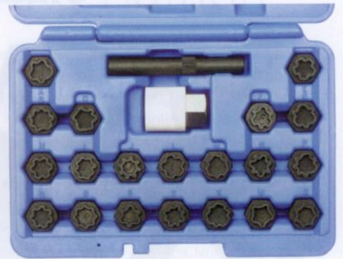
Die beiden neuen Felgenschlossschlüsselsätze wie das 22-teilige für Fahrzeuge des Herstellers Audi/VAG werden in einer speziellen Werkzeugbox geliefert

D er Werkstattausrüster Kunzer hat sein Produktprogramm für Autohäuser und Fachwerkstätten um Schlüsselsätze für originale Felgenschlösser der Fahrzeughersteller Audi/VAG und BMW erweitert. Dabei soll es sich um Spezialadapter handeln, die eingesetzt werden, wenn der Originalschlüssel nicht mehr vorhanden ist, um so ein zerstörungsfreies Lösen bzw. das Festziehen von Felgenschlössern zu ermöglichen. Der Schlüsselsatz für Fahrzeuge aus dem Volkswagen-Konzern besteht demnach aus 20 Adaptern mit codierten Profilen, einer Spezialaufnahme mit Halbzollantrieb samt Kunststoffschutz sowie einem Ausschlagdorn. Für Felgenschlösser des Herstellers BMW steht ein Schlüsseladaptersatz mit 20 codierten BMW-Profilen zur Verfügung, die Anbietersagen zufolge ohne weitere Adapter direkt eingesetzt werden können. Beide Sätze werden in einer speziellen Werkzeugbox geliefert, um mittels einer übersichtlichen Anordnung ein schnelles Auffinden des passenden Adapters zu gewährleisten.