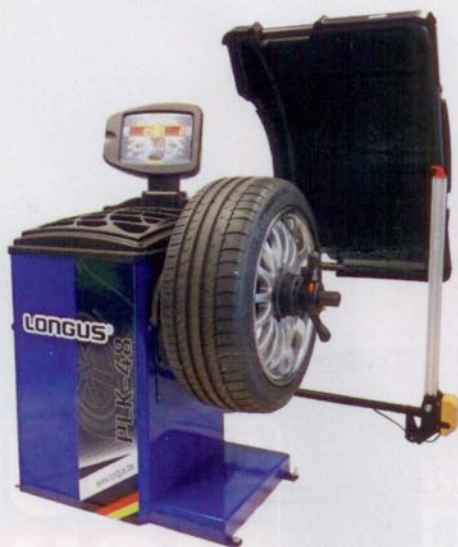
Die PLK-48 dreht das Rad automatisch in die richtige Position für die Anbringung der Ausgleichsgewichte.

ohne Montierhebel erfolgt. Der Spannungsbereich von 11 bis 24 Zoll deckt alle Anforderungen von Pkw-Fachwerkstätten ab. Mit moderner italienischer Software und neuem Design sind die Radauswuchtmaschinen PLK-47 und PLK-48 ausgerüstet. Sie verfügen über eine patentierte Positionsanzeige für Auswuchtgewichte. Stabil gelagerte Wuchtwellen sollen ein präzises Wuchtergebnis im Zusammenhang mit hochempfindlichen Sensoren sichern. Die LED-Innenbeleuchtung des Rades soll eine sichere optische Kontrolle während der Anbringung der Gewichte an der Innenseite der Felge ermöglichen. Die Radauswuchtmaschine PLK-43 ist ebenfalls mit italienischer Software und neuem Design ausgestattet. (FR)