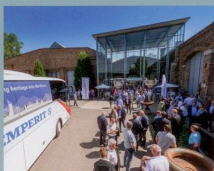
business industrie Sicherheit und Effizienz