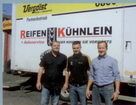
business handel Truck-Konzepte