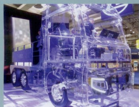
iaa Vernetzte Verkehrswelt