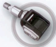
Clamp-in variabler Winkel

Schrader International GmbH Gewerbepark 15 85250 Altomünster, DE