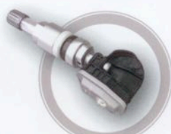
Clamp-in starrer Winkel