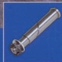
DIN- & Normteile

Hotline: +49 5156 9610-0 | www.st-templin.com