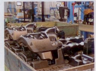
Will die Welt erobern: Die Modul T soll die Trommel zurückdrängen.