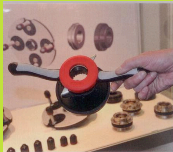
Die neue Spannmutter SoftGrip von Haweka hat einen Soft-Touch-Griff und verbesserte Gewindebacken mit einer größeren Auflagefläche.