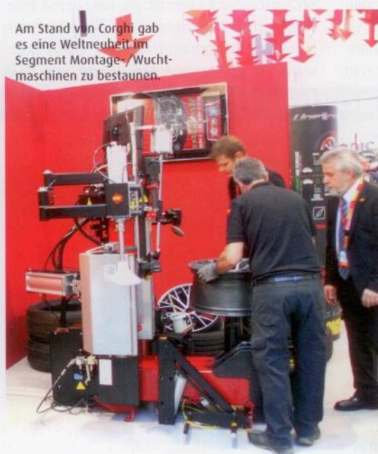
Am Stand von Corghi gab es eine Weltneuheit im Segment Montage-/Wuchtmaschinen zu bestaunen.