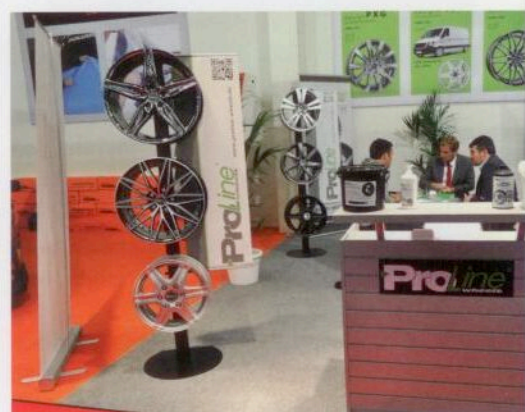
Als einer der ganz wenigen Felgenreisler zeigte ProLine Wheels Präsenz.

Mit dem Sonderpreis im Rahmen des Green Directory, dem Besucherführer zu besonders nachhaltigen und Ressourcen schonenden Produkten auf der Messe, wurde die Robert Bosch GmbH ausgezeichnet. Dieser Preis wurde ebenfalls bei der Eröffnungsfeier verliehen. Die nächste Automechanika Frankfurt findet vom 13. bis zum 17. September 2016 statt. (akl)