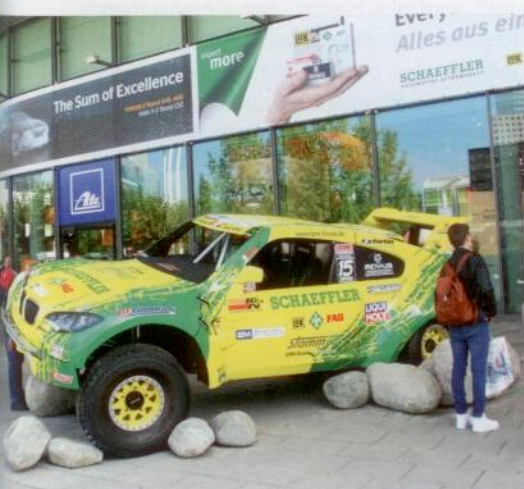
Der gemeinsame Messestand von Continental und Schaeffler im Forum bot viele interessante Produkte, Konzepte und Serviceleistungen.

Mit dem Sonderpreis im Rahmen des Green Directory, dem Besucherführer zu besonders nachhaltigen und Ressourcen schonenden Produkten auf der Messe, wurde die Robert Bosch GmbH ausgezeichnet. Dieser Preis wurde ebenfalls bei der Eröffnungsfeier verliehen. Die nächste Automechanika Frankfurt findet vom 13. bis zum 17. September 2016 statt. (akl)