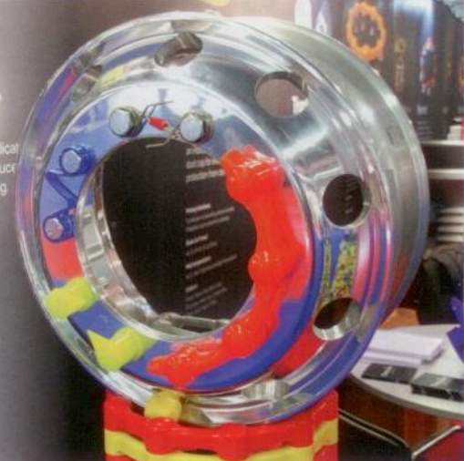
Am Stand des englischen Unternehmens Checkpoint gab es zahlreiche Variationen von Radmutternicherungen für Nutzfahrzeuge.

Seit 1997 vergibt die Messe die „Automechanika Innovation Awards“, die im Rahmen der Eröffnungsfeier verliehen wurden. 120 Bewerbungen waren in diesem Jahr eingegangen, von denen 66 aus Deutschland und 54 aus ausländischen Nationen stammten. Sieben Gewinner wurden von der achtköpfigen Jury, die sich aus Branchenexperten aus Verbänden, Medien und Industrie zusammensetzte, ausgezeichnet. Gewinner der Kategorie „Parts & Components“ ist die Continental Aftermarket GmbH mit ihrem VDO REDI-Sensor. Aus der Kategorie „Electronics & Systems“ setzte sich TEXA S.p.A. mit dem Produkt TEXA TMD MK3 durch. Ebenfalls führt das Unternehmen die Kategorie „Repair & Diagnostics“ an, hier überzeugte Augmented Reality Glasses by Texa die Jury. Die PANNEX AG setzt sich mit dem PANNEX Reifendichtmittel an die Spitze der Kategorie „Accessories“. Im Bereich „Repair & Maintenance“ konnte der MFP 3000 MAHA Fahrprüfstand der Firma MAHA Maschinenbau Haldenwang GmbH & Co. KG überzeugen. Die Software für 3D-Messegeräte, Vision 2 von Car-O-Liner AB, gewinnt in der Kategorie „IT & Management“ und mit der modular aufgebauten Pumpe belegt Industrie Saleri Italo S.p.A. Platz eins in der Kategorie „OE Products & Services“.