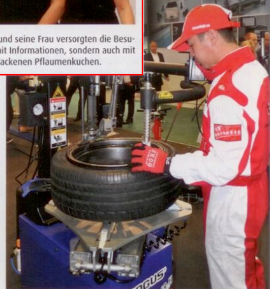
Vorführung der automatischen Reifenmontiermaschine PLM-18-H von Longus am Messestand.