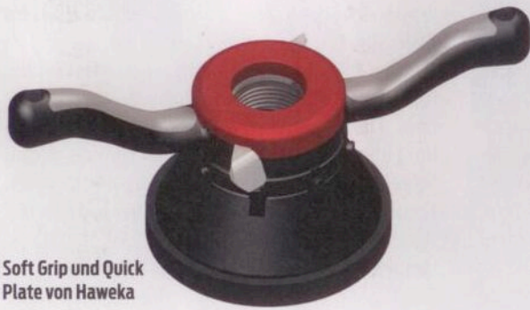
Soft Grip und Quick Plate von Haweka