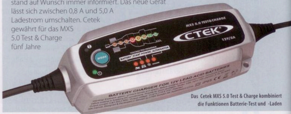
Das Cetek MXS 5.0 Test & Charge kombiniert die Funktionen Batterie-Test und -Laden

Das MXS 5.0 Test & Charge kombiniert die Funktionen von Batterietest- und Ladegerät. Zusätzlich zum bekannten MXS 5.0 bietet das neue Modell drei zusätzlich integrierte Testprogramme zum Messen der Batteriespannung, der Startfähigkeit und der Lichtmaschinen-Ausgangsspannung. Die Messergebnisse werden über eine zusätzlich zur Ladeanzeige installierte LED-Anzeige visualisiert. Der Anwender erspart sich so den Wechsel zwischen zwei Geräten und ist über den Batteriezustand auf Wunsch immer informiert. Das neue Gerät lässt sich zwischen 0,8 A und 5,0 A Ladestrom umschalten. Cetek gewährt für das MXS 5.0 Test & Charge fünf Jahre