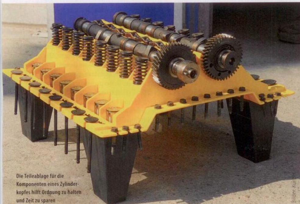
Die Teileablage für die Komponenten eines Zylinderkopfes hilft Ordnung zu halten und Zeit zu sparen

Teile, wenn zum Beispiel die Ventile geschliffen werden, beugt die Teileablage Verwechslungen der Komponenten vor.