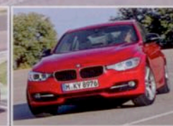
BMW 3er ab 12.000 €