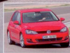
VW Golf VII ab 10.100 €

Deutschlands Lieblinge AUDI A3 AB 9500 €