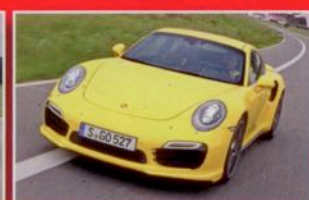
SPORTWAGEN PORSCHE 911