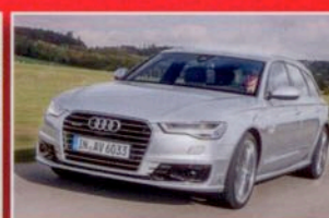
OBERKLASSE AUDI A6