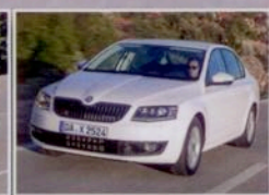
Skoda Octavia ab 6600 €