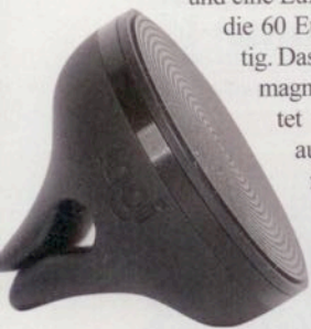
Die Magnet-Handyhalterung lässt sich am Lüftungsschlitze recht gut festklemmen

Logitech verspricht, mit einer günstigen Nachrüstlösung die Smartphone-Bedienung komfortabler und sicherer zu machen. Dazu sind eine kostenlose App für das Android-Smartphone und eine Lüfter-Halterung, die 60 Euro kostet, nötig. Das Telefon haftet magnetisch und startet via Bluetooth automatisch die nötige Software. Von der Funktion haben wir uns selbst