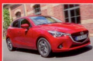
KLEINWAGEN MAZDA 2