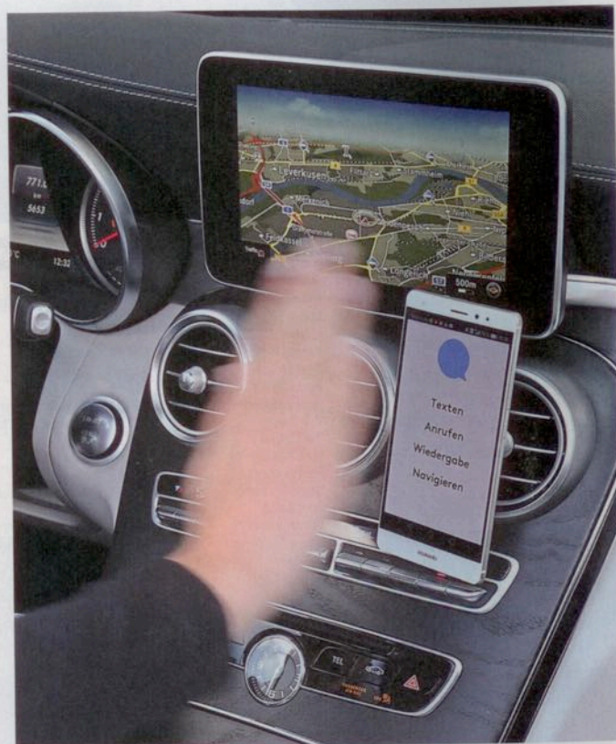
Die Bedienung per Wisch- und Sprachbefehl soll den Fahrer weit weniger ablenken, zudem muss er das Smartphone nicht berühren.