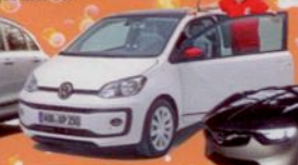
Neuer VW Up