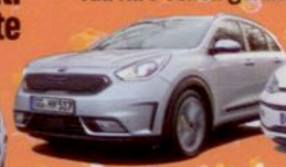
Kia Niro schon gefahren