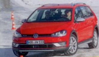
VW Golf Alltrack