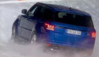
Range Rover Sport