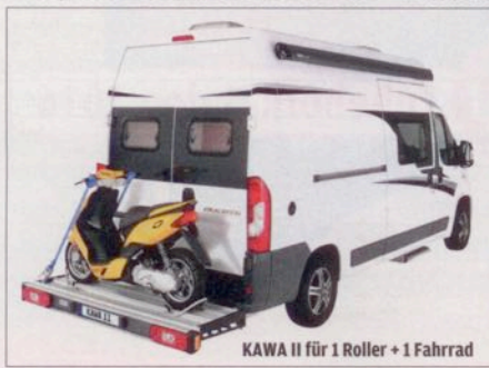
KAWA II für 1 Roller + 1 Fahrrad