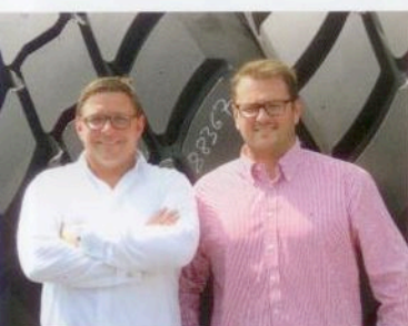
Runderneuerung Qualitätsversprechen S. 68