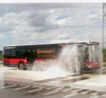
Continental 3. Busreifengeneration S. 36