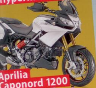
Aprilia Caponord 1200