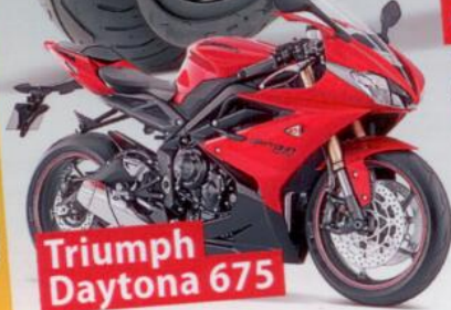
Triumph Daytona 675