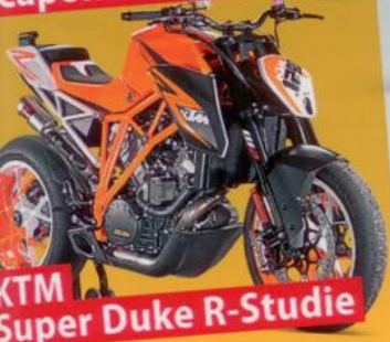
KTM Super Duke R-Studie