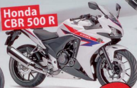
Honda CBR 500 R