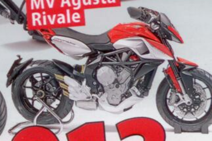
MV Agusta Rivale