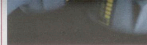
Neue Schlagschrauber von Schneider airsystems für nahezu jeden Anwendungszweck.

Für nahezu jeden erdenklichen Anwendungszweck hat Schneider airsystems neue Schlagschrauber in ihrem Portfolio. Der kleinste im Sortiment ist der «Pocket», der nächst größere und stärkere der «Mini». Der «Allrounder» sowie der «Reifenspezialist» sind dann von ihrer Leistung her auch schon für das Lösen und festziehen von PKW Radschrauben gedacht. Das nächst größere Modell ist das «Power-Paket» und in Werkstätten, in denen neben Pkw auch Nfz auf der Hebebühne stehen, ist der «Leistungsprofi» vorgesehen. Für das Schrauben an Lkw und Bussen empfiehlt Schneider den siebten im Bunde, den «Kraftprotz». Schon die kleinen Schlagschrauber im Sortiment punkten durch hohe Lösedrehmomente. Insbesondere die lange Lebensdauer sowie die geringen Vibrationen seien laut Schneider für jeden der sieben Schlagschrauber hervorzuheben. (mf)