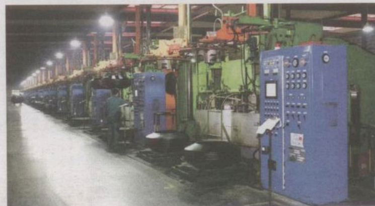
Liefert Momo-Reifen: Vulkanisierstraße im chinesischen Reifenwerk Jinyu.

Florenz, dem zweitgrößten Groslisten des Landes. Dieser will den jährlichen Reifenabsatz von bisher etwa 1,5 Millionen Reifen jährlich durch eine eigene Reifenmarke steigern, aber nicht wie oft üblich als Eigenmarke mit Exklusivrechten.